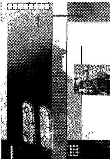
De kافت van de Handleiding Brandweezorg uit 1992