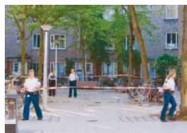
De politie zette na de schietpartij de omgeving af met linten.

BARBARA DE JONG barbara.de.jong@metronieuws.nl