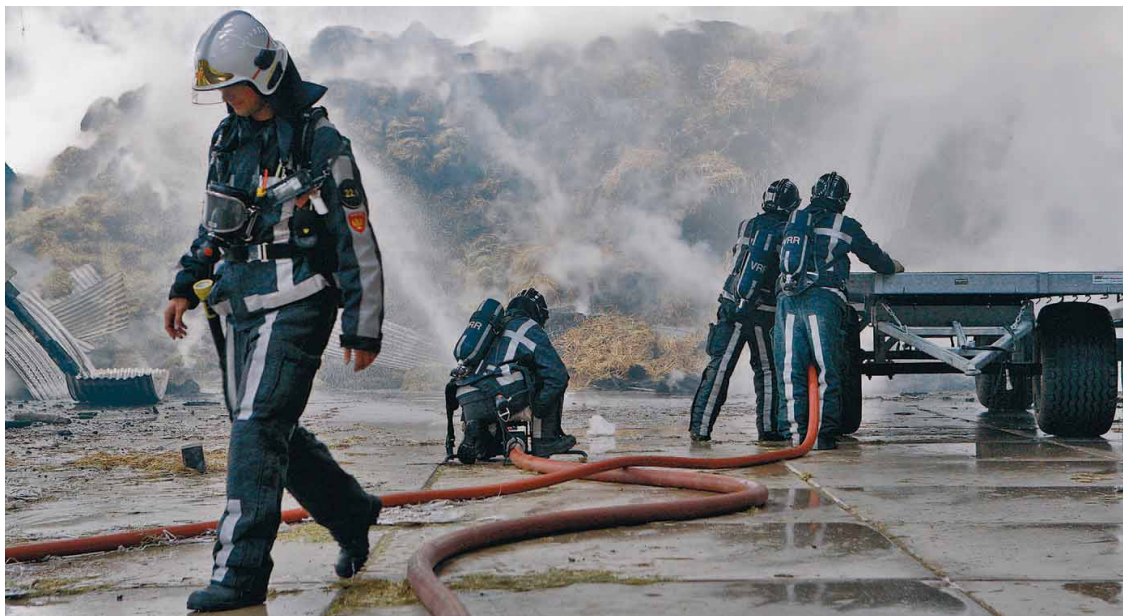
Bij de brandweer, voor velen was het vak een jongensdroom. Maar het speelt steeds minder tot de verbeelding.