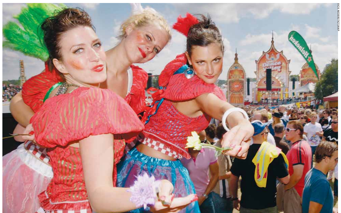
Heerlijk weer en een prima sfeer: het dancefestijn verliep zonder grote problemen.

Stelling van vandaag: Ik meld me aan als vrijwilliger bij de brandweer of politie.